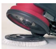
Accroche rapide de la brosse