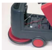
Accès rapide aux batteries