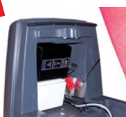
Version chargeur intégré IBC