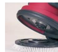
Accroche rapide de la brosse