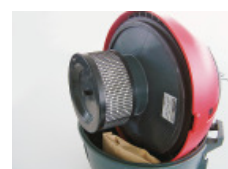
Filtre S10+ HEPA