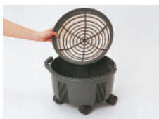
filtre coton S10+ & SL