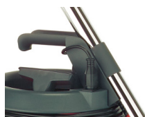
Poignée Multi-fonctions + câble détachable