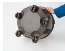
5 roulettes multi-directionnelles S10+