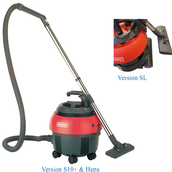
Version S10+ & Hepa