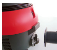
Connexion de cuve emboîtable